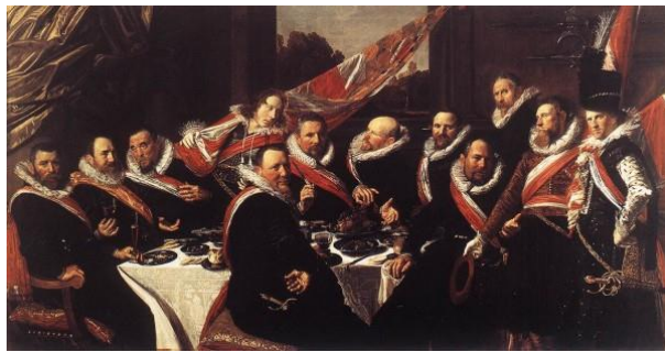
Franz HALS (1582-1666), Le banquet des officiers de la compagnie de St Georges , 1616, huile sur toile, 175 x 324 cm, musée Frans Hals, Pays-Bas.