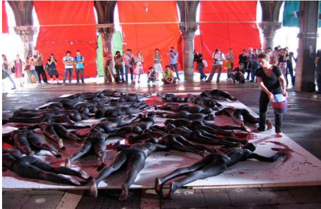
Vanessa BEECROFT (1969-), B61, Still Death! Darfur Still Deaf ? (Toujours Mort! Darfour toujours sourd ?), 2007, performance , Biennale de Venise.