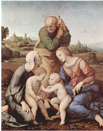
Raphaël (1483-1520), Sainte Famille avec Sainte Elisabeth et Jean-Baptiste , 1507-1508, huile sur toile, 131 x 107 cm.