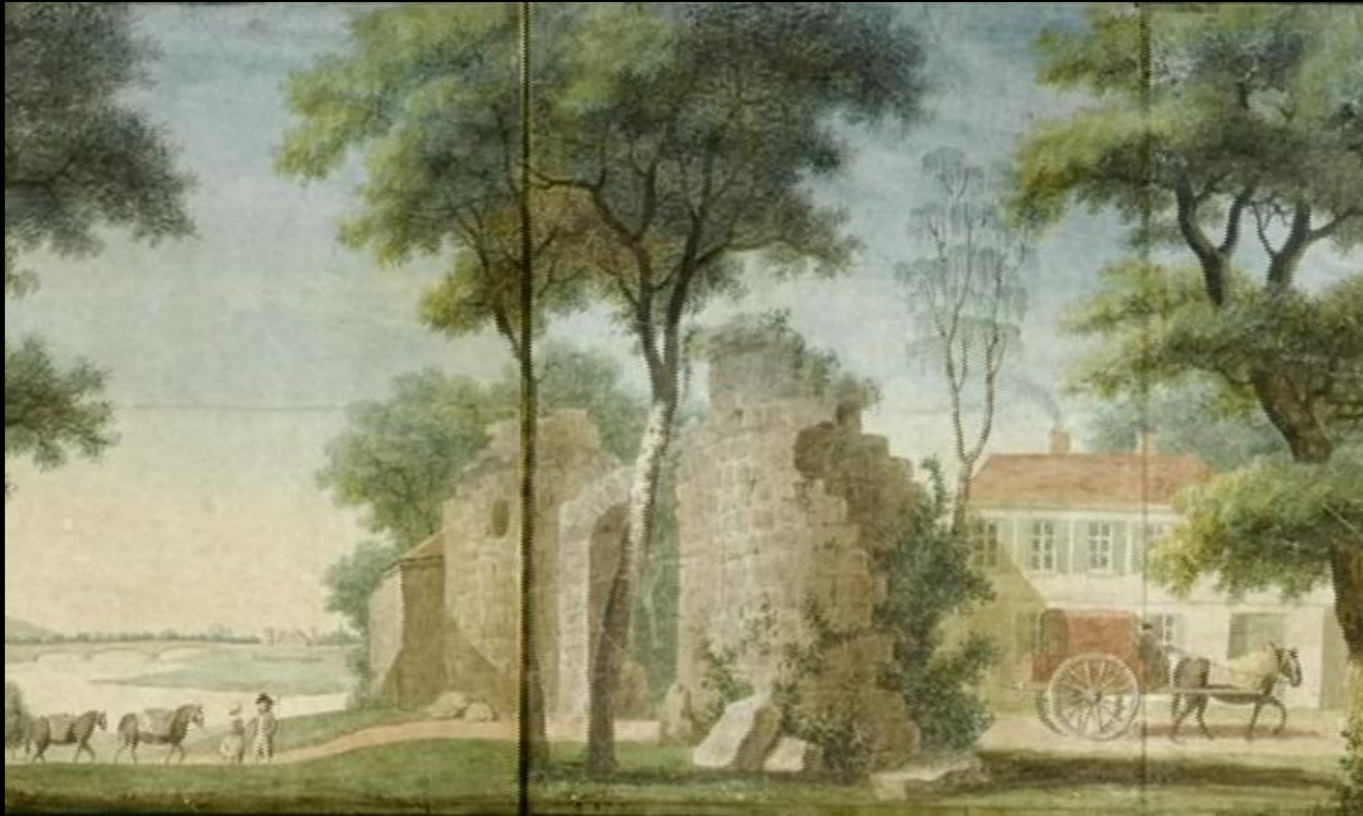
Le jardin pittoresque.