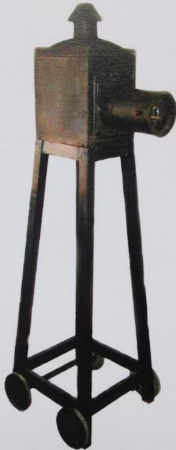
Fantascope 192 x 50 x 60 cm Vers 1795-1810