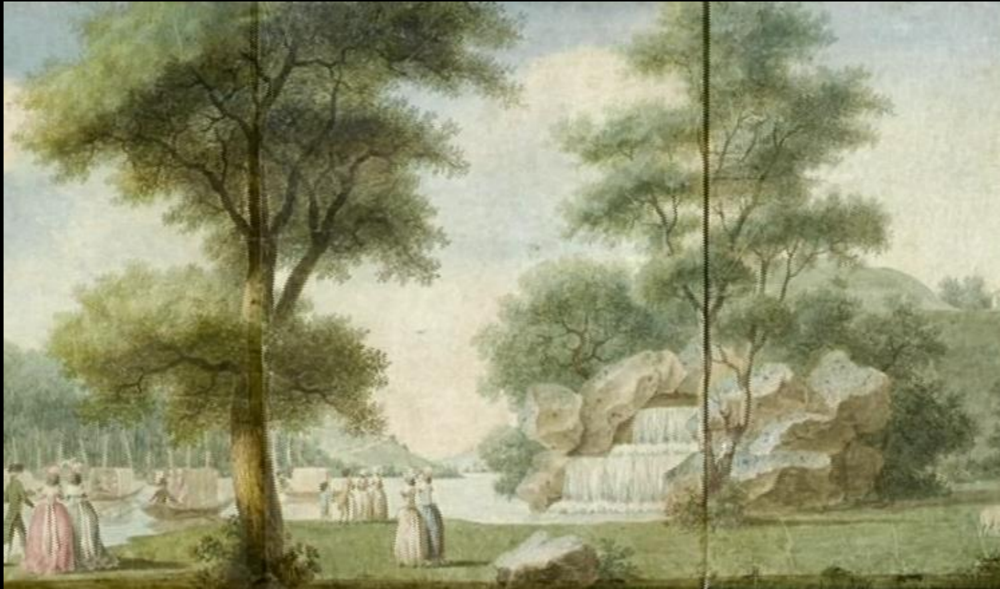
Le jardin pittoresque.