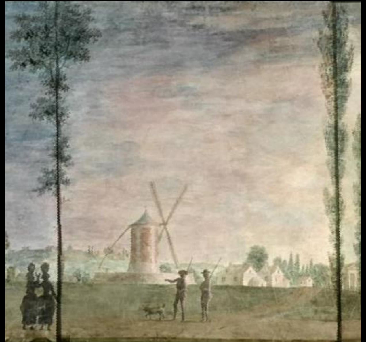
Le jardin pittoresque.