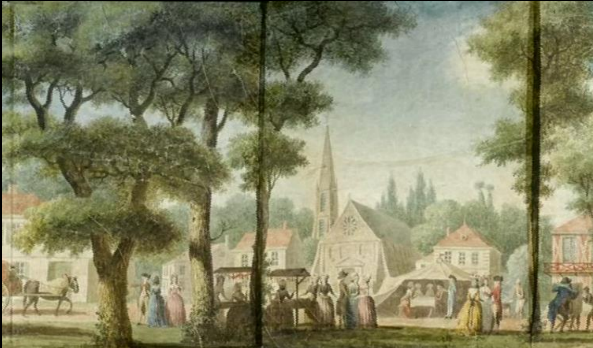
Les paysages et architectures d'île de France.