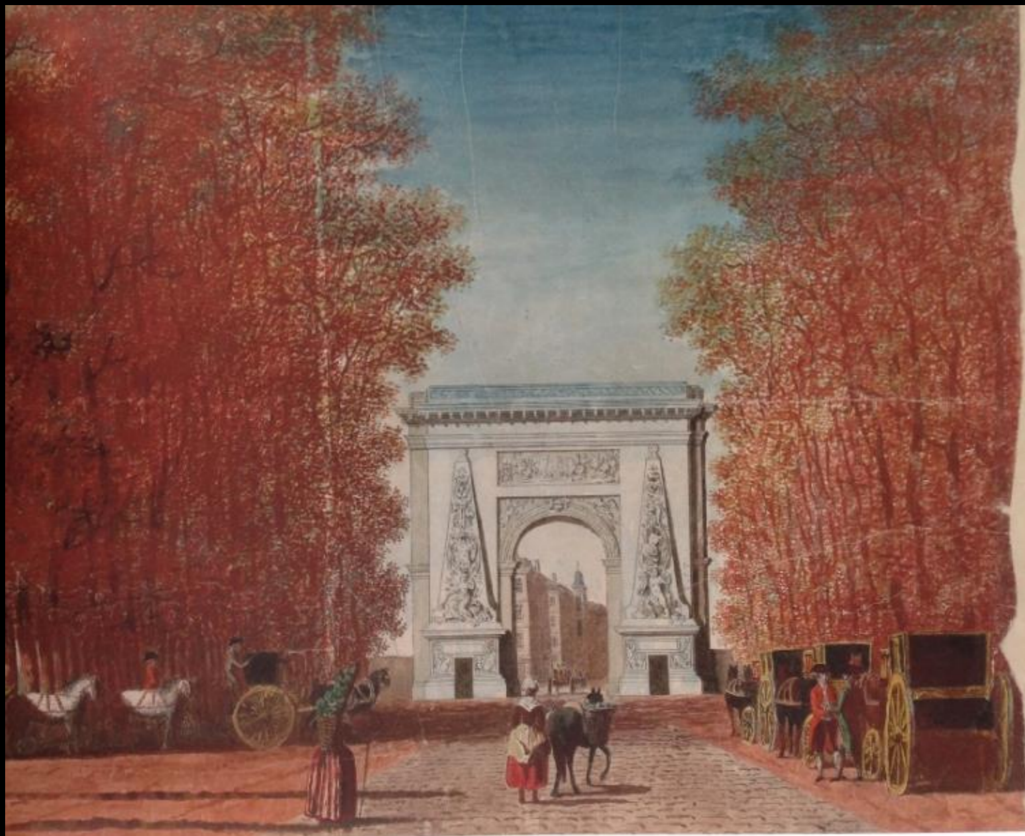
La porte Saint Denis à la fin du transparent des quatre saisons.