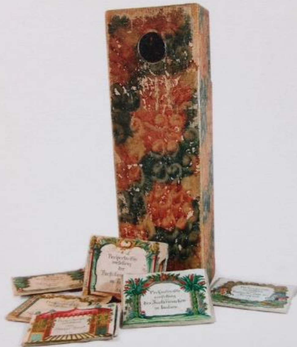
Théâtre d'optique d'Engelbrecht 49 x 16 x 11 cm Allemagne, seconde moitié du XVIII e siècle