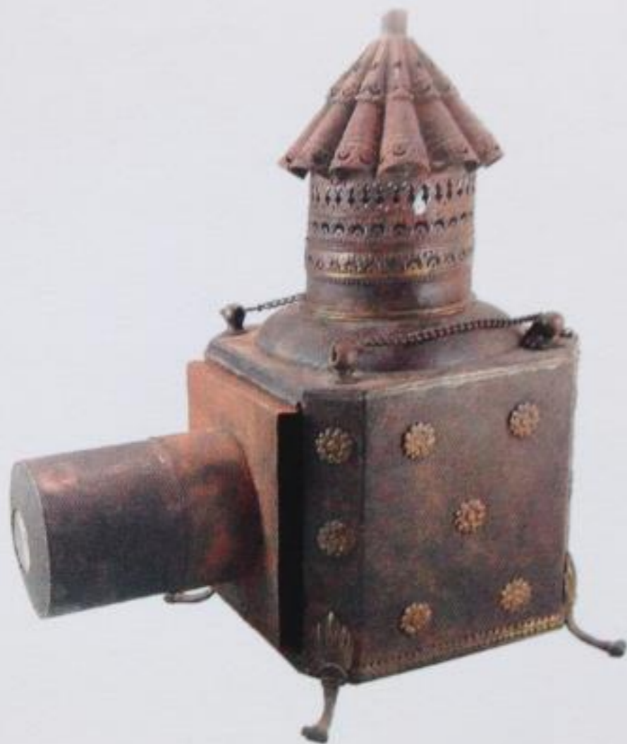
Lanterne magique de salon H. 35 cm France, vers 1760