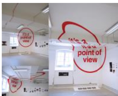
Chiharu SHIOTA, Infinity , 2014.