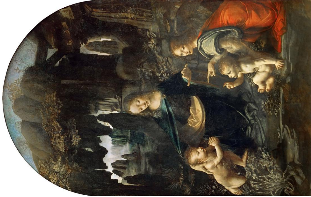
Léonard de VINCI (1452-1519), La Vierge aux rochers , 1483-1486, huile sur panneau, 199 x 122 cm. Musée du Louvre, Paris.